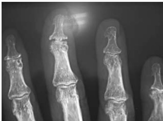
Figura 3. Pinzamiento de interlíneas articulares, osteofitos, erosiones centrales e imágenes en «alas de gaviota» típicas de la artrosis erosiva de la mano.

izquierda y de IFD sugeriría una APso, las erosiones de las cabezas de los quintos metatarsianos (Fig. 5) son típicas de la AR, así como la positividad del FR y anticuerpo del péptido citrulinado cíclico. Las imágenes de afectación de IFP e IFD, pinzamiento de interlíneas, osteofitos, erosiones centrales, imágenes en alas de gaviota (Figs. 3 y 4) son típicas de AM, y en este caso, en particular, de artrosis erosiva de mano.