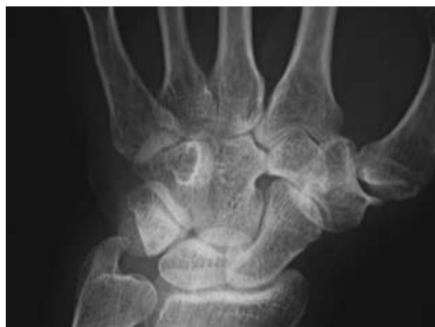
Figura 6. Reducción de la interlínea de la articulación trapecio metacarpiana con esclerosis subcondral en trapecio y osteofito marginal, imagen típica de una rizartrrosis.

artrosis de IFD, sin embargo en algunas ocasiones hay otras enfermedades con las que hay que establecer el diagnóstico diferencial, y entre ellas mencionaremos: