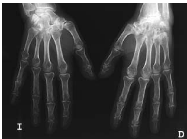
Figura 1. Distribución asimétrica de las lesiones de la AR en esta paciente con una carpititis severa en mano derecha en contraste con el carpo contralateral.

Las alteraciones de la AM pueden ser bilaterales, simétricas o asimétricas. Las articulaciones principalmente afectadas son IFP, IFD y TMC, pero respeta, por lo general, las articulaciones MCF (excepto en la condrocalcinosis).