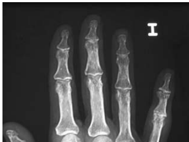
Figura 4. Detalle de la misma paciente que permite visualizar mejor las lesiones en IFP e IFD.

Mujer de 57 años de edad, administrativa, que acude a consulta de reumatología por presentar un cuadro de 3 semanas de evolución de dolor insidioso, de características mecánicas en el borde lateral de la mano derecha en su cara dorsal a nivel articulación TMC, acompañado de dificultad para escribir o cargar pesos, o cualquier otro movimiento de prensión.