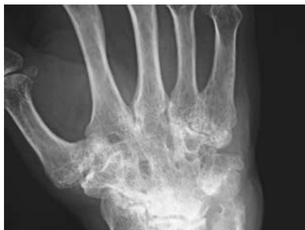
Figura 2. Carpititis severa de la mano derecha con pérdida de todos los espacios articulares, anquilosis del carpo y erosiones en articulaciones radio-carpiana y cúbito-carpina.

La situación especial de la llamada artrosis erosiva de la mano, como ya hemos dicho anteriormente, clínicamente, puede cursar de forma abrupta. Los nódulos de las articulaciones IFP e IFD se asocian con edema, dolor e impotencia funcional. Los reactantes de fase y las serologías son negativos. La distribución es bilateral simétrica o asimétrica. Predomina la afectación de las IFP e IFD. Los cambios radiológicos se caracterizan por una combinación de erosión y proliferación ósea. Los osteófitos son los típicos de la AM, predominando en los márgenes articulares, acompañando al estrechamiento del espacio articular y a la esclerosis subcondral. Las erosiones pueden llegar a ser prominentes y, comúnmente, están en la porción central de la articulación. La localización